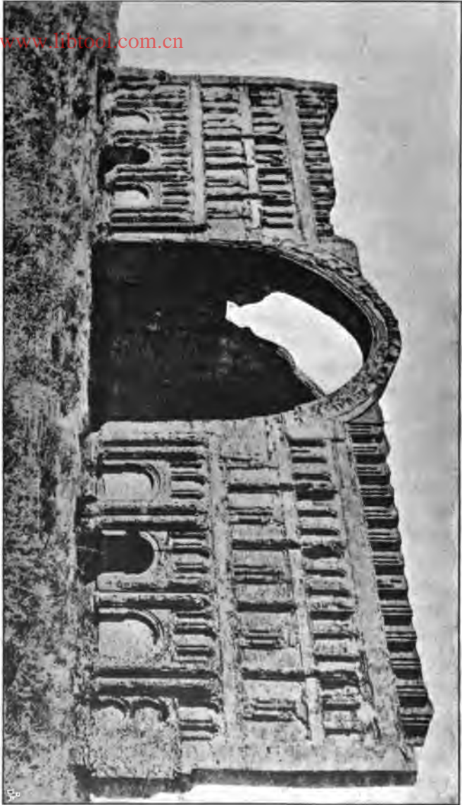
Kongepaladset i Ktesifon i dets nuværende Tilstand.

(Paladset byggedes ca. 550 e. Kr. af Khuro I Ansocharvan. Siden tog Kallierne Mansur og Muktafi Stene derfra for at anvende dem til Bygning af Paladser i Bagdad. — Audenshallen ses i Midten.)