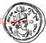
Bahrâm Tschôbin. (Efter en Mønt).