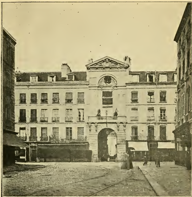
Maison rue Royale, n° 3, où fut installée la salle de spectacle de Versailles, de 1736 à 1777.