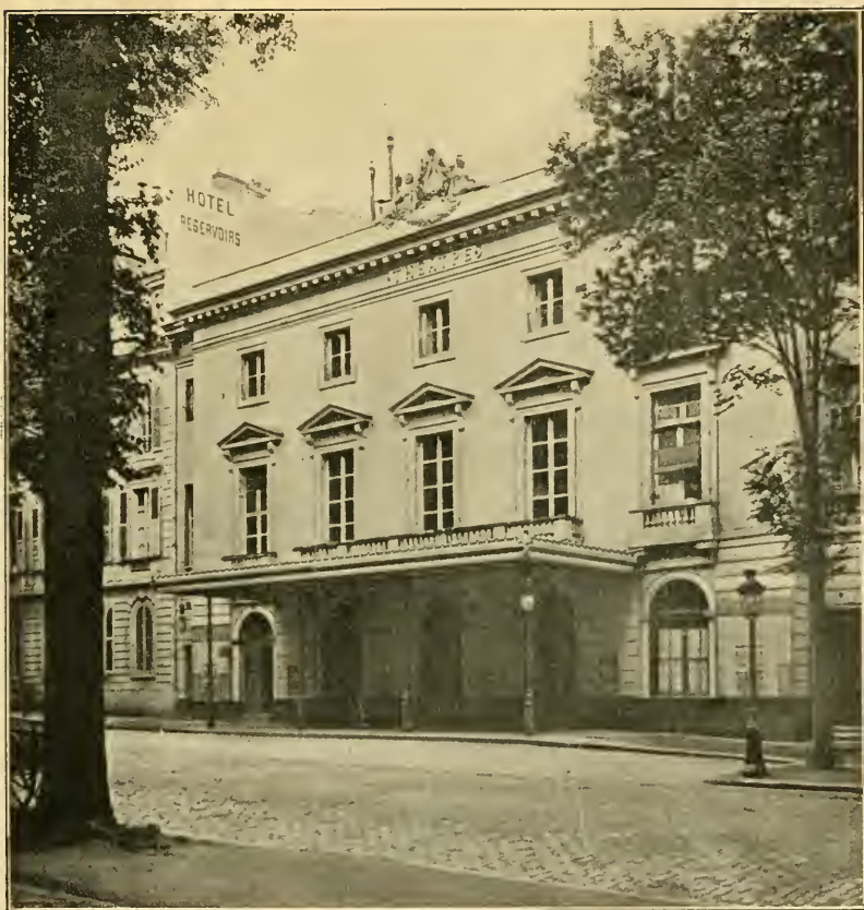
Façade actuelle du Théâtre de Versailles, construit et inauguré par M lle de Montansier en 1777.