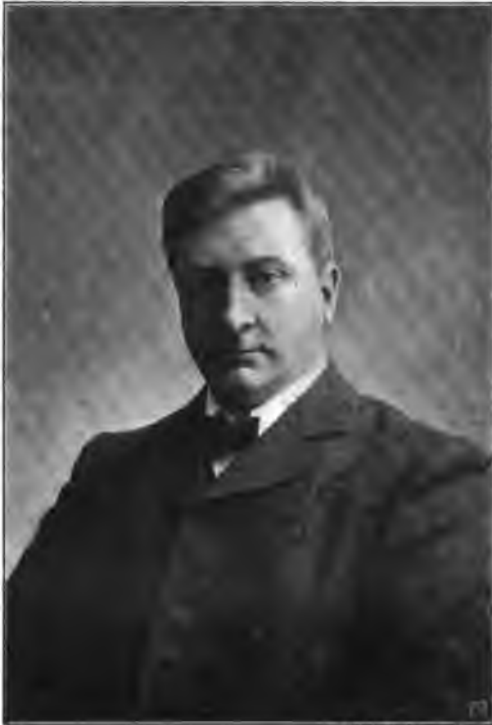
Ein. Enger, photo.

udfattige Latinskolelærer, en Grubler uden Evne til at hævde sig blandt Menneskene, en nogen Sjæl med sygelig ømtaalige Sanser, ham mødte vi først i Dostojevskijs Romaner. Og hans epileptiske Søster ligesaa. Men — og deri bestaar Originaliteten — Digteren har skabt dem paany. Han har evnet at stedbinde dem til den lille norske By, hvor deres triste Livslob udspilles.