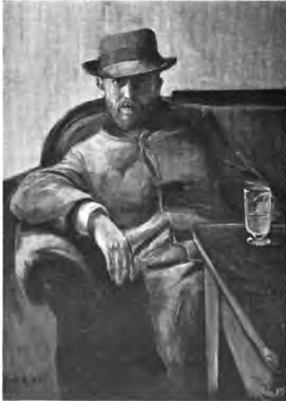
HANS JÆGER. Efter Edv. Munchs Maleri.

JÆGERS Læremestre er de store romantisk-spekulative Tyskere, først og fremst Hegel, men ogsaa Fichte: Panlogismen, Hævdelsen af Følelsens suveræne Ret, Romantikens Freigeisterei der Leidenschaft. Men egentlig staar han den revolutionære Efterromantik