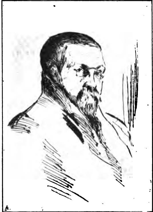
TRYGGVE ANDERSEN. Radering af Henrik Lund.

„I Cancelliraadens Dage“ var ingen saakaldt historisk Roman, fuld af barnslig Romantik og Fantasteri. Heller ikke noget Kursus i Patriotisme, foredraget i en bombastisk dunkel og drømmende Stil. TRYGGVE ANDERSEN