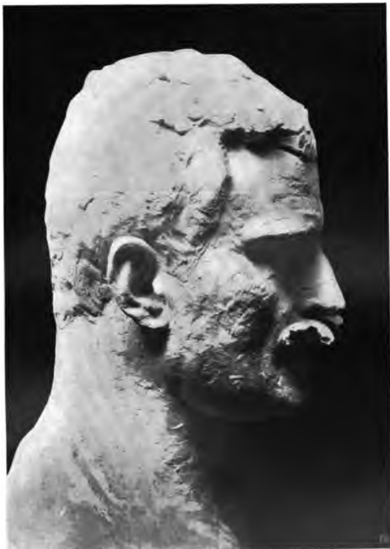
Byste af Gustav Vigeland.