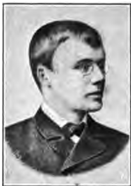
GUNNAR HEIBERG. (Ungdomsportræt).

I samme Aar som Knut Hamsun udgiver sin første Bog, den komisk naive og underlige „Bjørger“, træder ogsaa GUNNAR HEIBERG frem for et større Publikum. Og skjønt