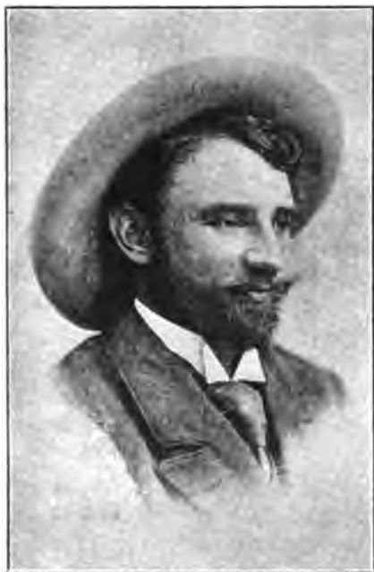
NILS COLLETT VOGT.

sig til for Alvor at skræmme han, de truer bl. a. med at ville sende ham tilsjøs, falder han tilfode. Han ser sig snart i Billedet af en fra Samfundet Udstød og Forjaget, som har hele Menneskeheden til Forfølger. Verden er et Fængsel, og han sidder dybt nede i Mørket, bundet og bastet, og skriger efter Lys og Frihed. Men ingen løser hans Lænker. Og saa vælger han da at blive som de andre.