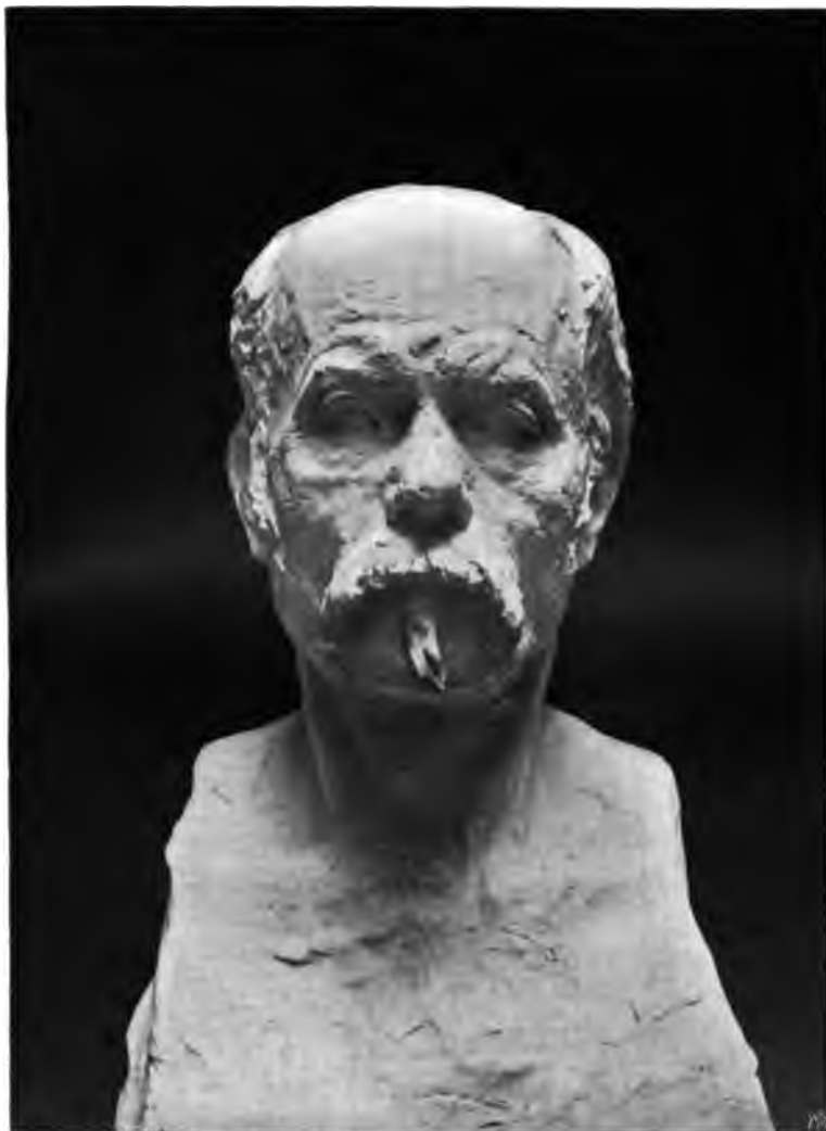
Byste af Gustav Vigeland.