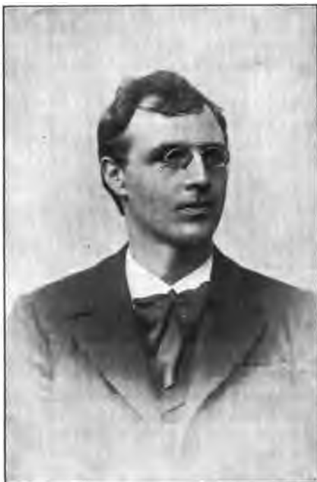
HANS E. KINCK.

Til syvende og sist maa vi forresten indrømme, at han paa sin Fart mod Ærens Tinde ikke er blevet værre end de saakaldte hæderlige Folk omkring ham. Han dækker sig ihvertfald ikke med Gudelighed og Bibelsprog, naar han snyder sin Næste. Og i én Henseende staar han over sine Omgivelser: han føler omsider Foragt for de lurvede Forhold, som ikke kan udklække andet end en af Armoadsdom, raa Griskhed og Misundelse forkrøblet Almue.