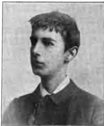
VILHELM KRAG 17 Aar gammel.

Dog, ogsaa ungdommelig umiddelbar Livslyst har sine Sange i denne Bog. Den tyveaarige Digter kan stundimellem anslaa høist letsindige Toner. Han optræder da som den glade Landeveisstryger og Troubadour — en nær Slegtning af Drachmanns farende Svend — og priser af fuldt Hjerter, hvad alverdens Poeter til alle Tider har besunget: Pigernes Skjønhed og Vinens Lyst, Solskin og Sommer, Roser og Ranker und alles Menschenbegehre . . .