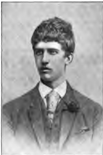
THOMAS P. KRAG. Portræt fra 1888.

Udpaa Høsten 1891, da saa mange af det yngre Slegtleds Forfattere træder ind i Litteraturen, kom ogsaa THOMAS P. KRAGS første Bog. Den hed „Jon Græff“ og var en mørk, monoton Livshistorie fra Sørlandet, — det Kyststrøg, som er denne Digters Fødeegn og særlige Provins 1) . Fortællingens Hovedperson var en af disse ensomme, indesluttede, forsagte og fortrykte Karakterer, som helt fra Barndommen af kommer paa Skyggesiden af Tilværelsen og blir der til sin sidste Dag. Den Stil, hvori denne