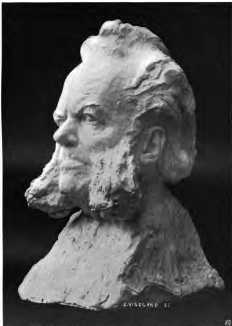
Byste af Gustav Vigeland