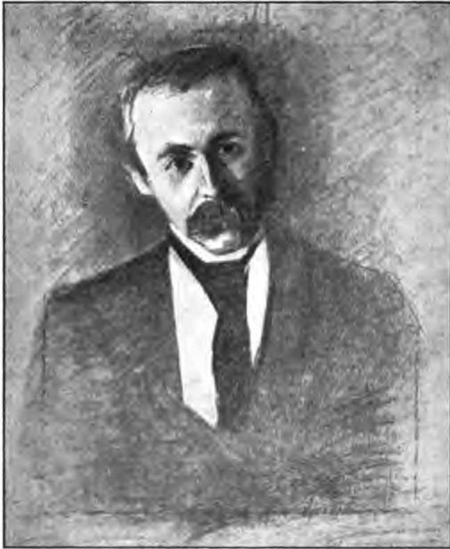
Oda Krohg del.

menneskelig Følelse og Tanke. Thi Drømmen er født af Livets Sorg. Og alene i den kan du frit udfolde, den uendelige Længsel, som bor dybest i din Sjæl.