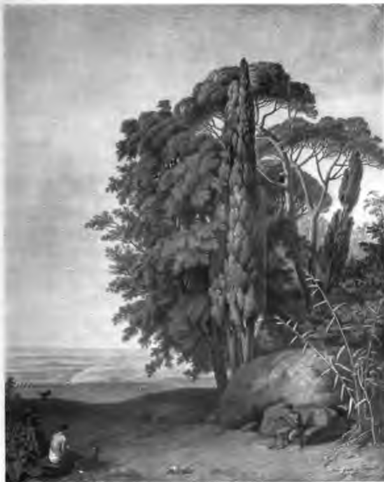
6. Arkadische Landschaft