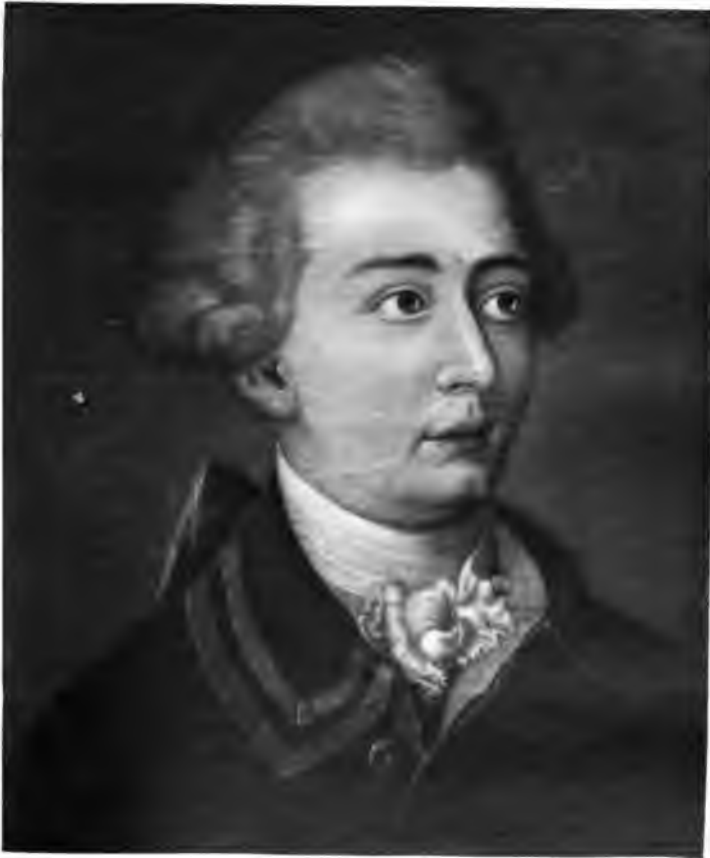
1. Selbstbildnis (circa 1771)