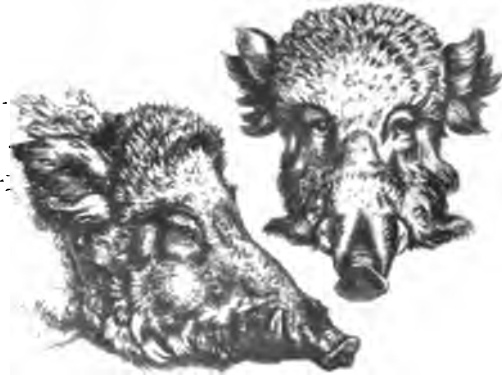
15. Hasenkopf (Radierung) Eberköpfe (Radierung)