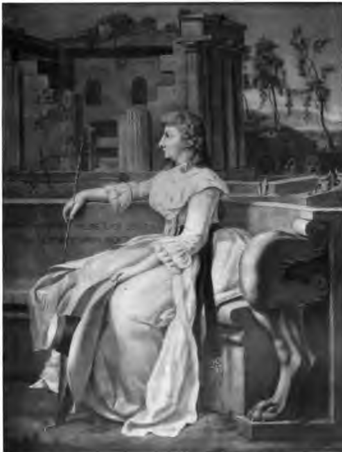
12. Herzogin Anna Amalia von Weimar