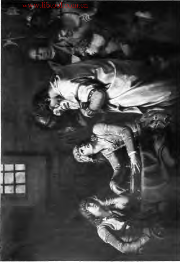
7. Conradin von Schwaben und Friedrich von Hesse im Kerker