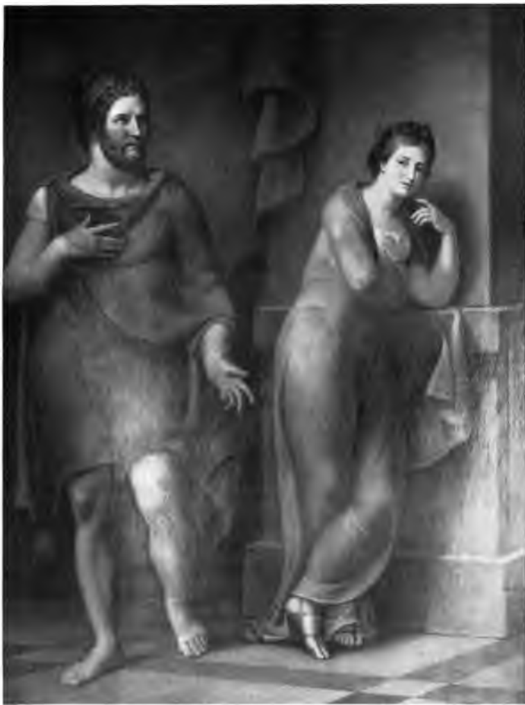
24. Odysseus nimmt Abschied von Nausikaa