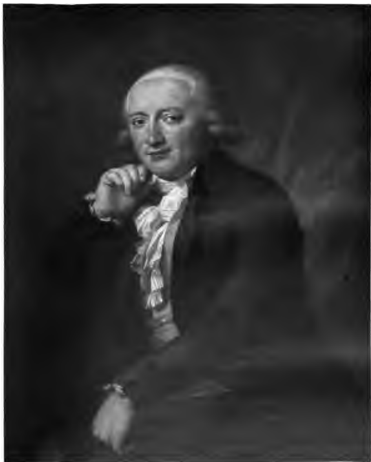
2. Männliches Bildnis