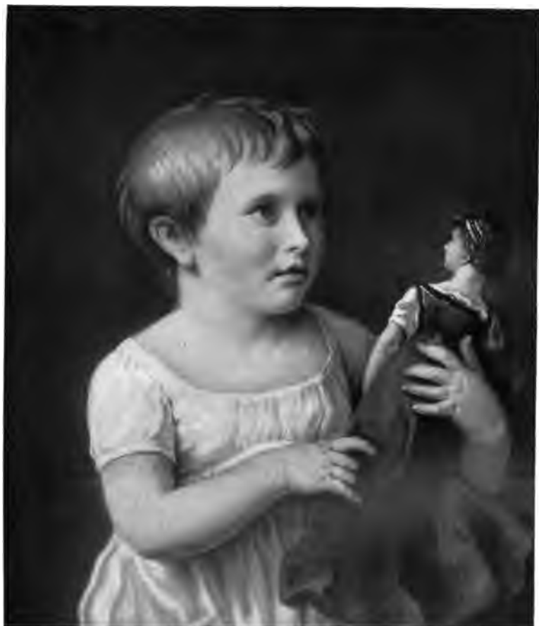
21. Kinderbildnis Amfing