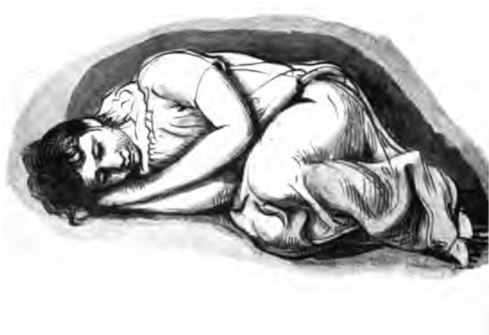
20. Schlafendes Kind (Studie)