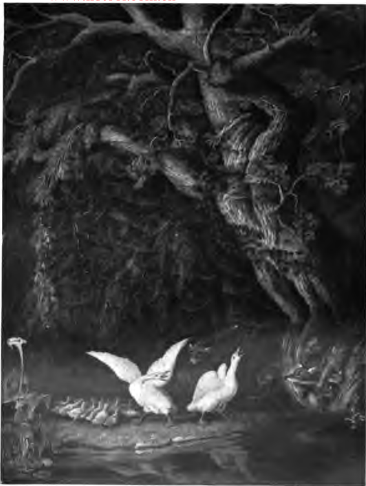
32. Füchse und Enten