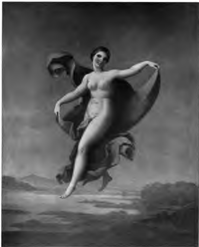
25. Schwebende weibliche Gestalt (aus der »Ibylle«)