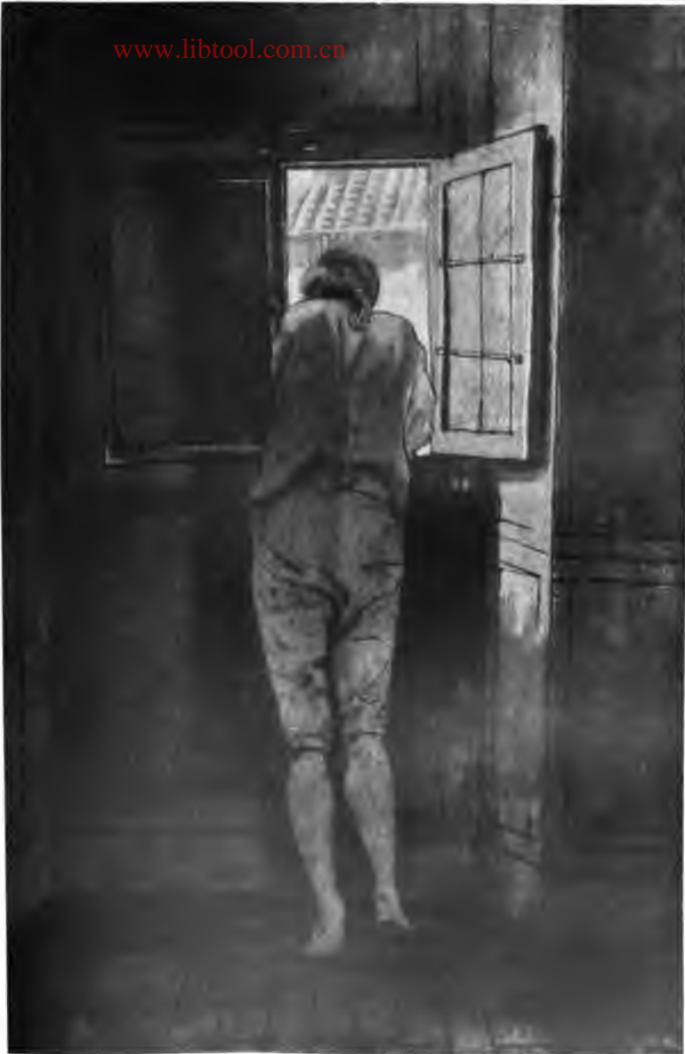
10. Goethe am Fenster (Aquarell)