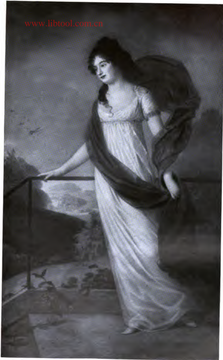
17. Weibliches Bildnis