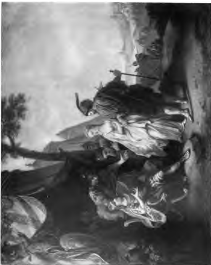
14. Maffinissa und Sophonisbe