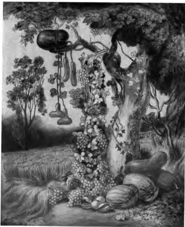
30. Die Fülle der Natur