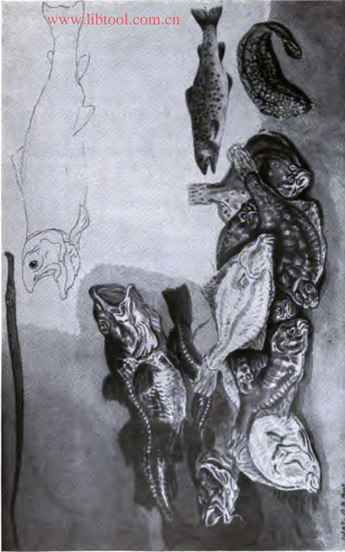
23. ഏകദേശം (സമീപനം)