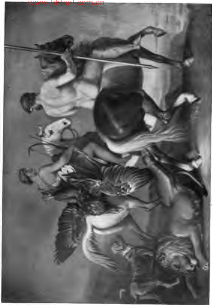
27. Die Stärke des Mannes