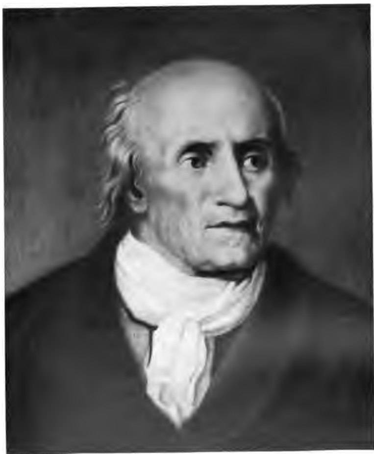
16. Bildnis Klopstocks