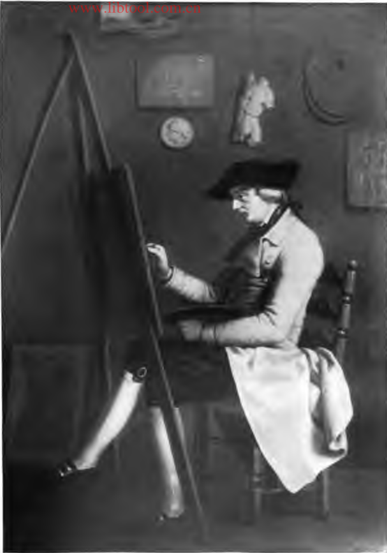
8. Selbstbildnis (1785)