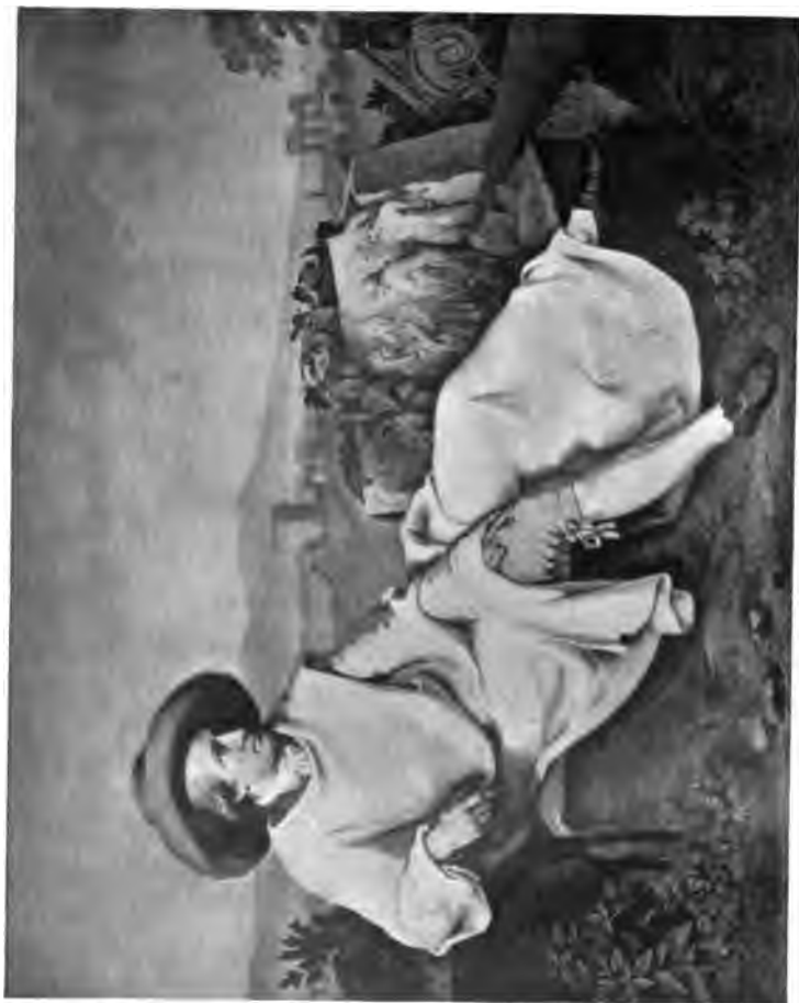
11. Goethe in der Campagna