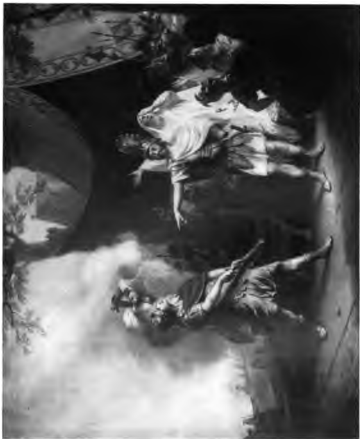
13. Der Streit