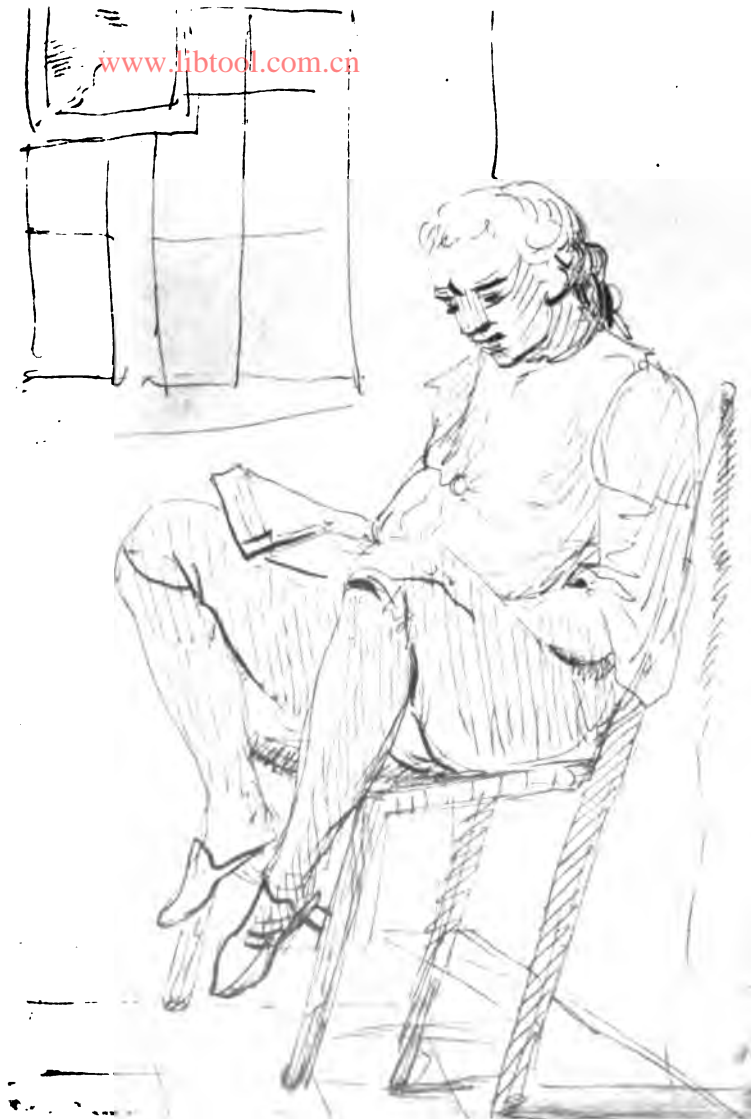
9. Goethe in seiner römischen Wohnung