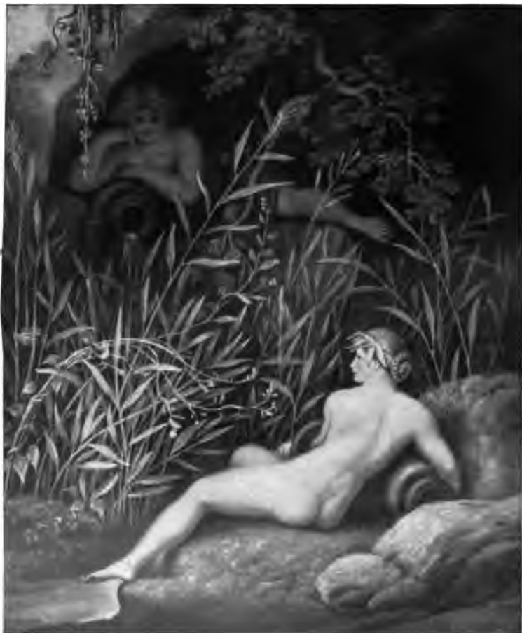
26. Quellsymphhen (aus der »Idylle«)