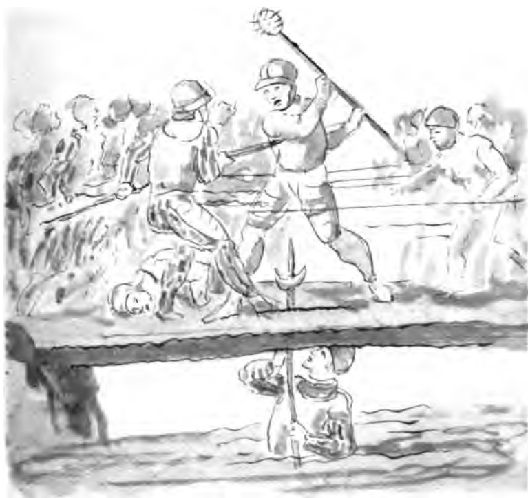
5. Aufzeichnung zum Schweizer Tagebuch