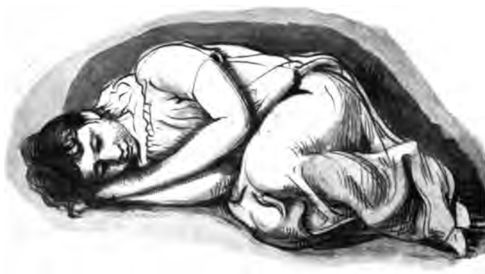
20. Schlafendes Kind (Studie)