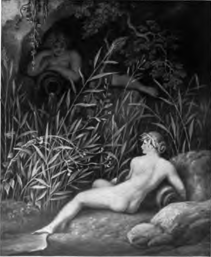
26. Quellnympfen (aus der »Idyllen«)